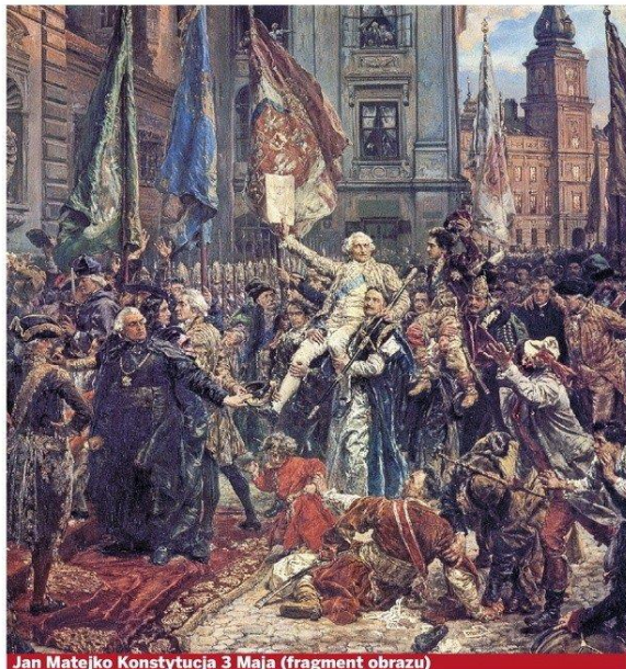
Jan Matejko Konstytucja 3 Maja (fragment obrazu)